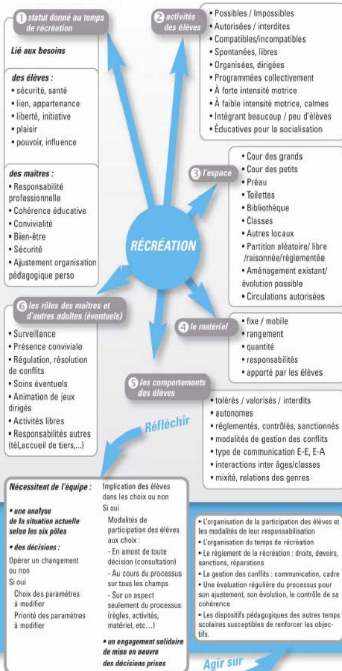
Schéma paru dans la revue Animation & Education - juillet-Octobre 2013 - n°235-236 Retrouvez l'intégralité de la démarche dans l'article en libre accès sur http://animeduc.occe.coop